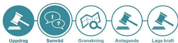
Figur 2 Här är vi nu.

Det aktuella planskedet är samråd då remissinstanser, fastighetsägare och andra berörda får ta del av förslaget och komma med synpunkter. Efter samrådet upprättas en samrådsredogörelse där synpunkter som framförts under samrådet redovisas. Planförslaget kan komma att justeras och kompletteras vid behov innan ett granskningsförslag upprättas.