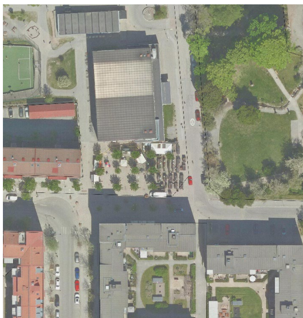
Figur 3 Område för planändringen med fastighetsgränser

Planändringen genomförs inom fastighet Vilunda 12:1 som ägs av Upplands Väsby kommun.